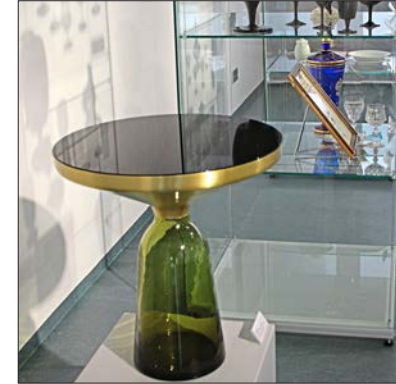
Star des modernen Designs bei Poschinger: „Bell Table“.