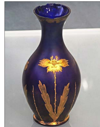
Vase , irisiert mit Golddekor, um 1900.