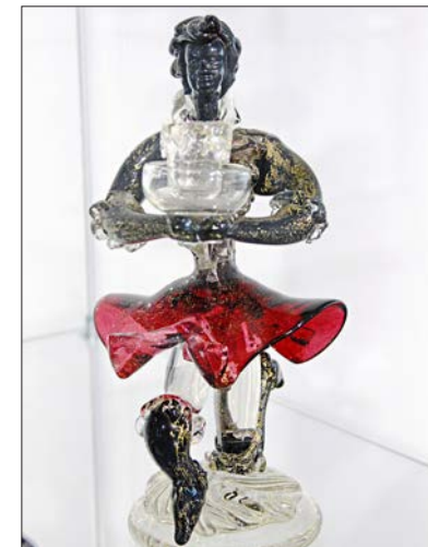
Kerzenhalter , freihandgeformt, vermutlich 1980er Jahre.