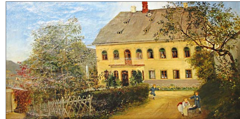
Herrenhaus der Poschinger i, Öl a.L., 1875, Künstler unbekannt.