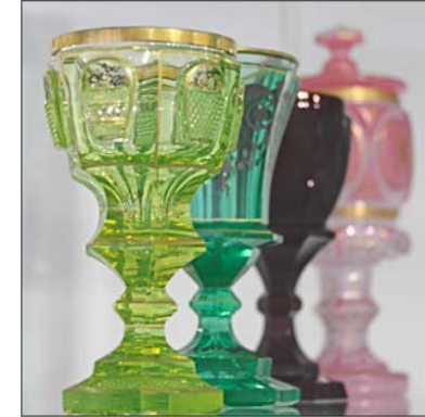
Glaspokale aus Uran, Rothyalith und Alabaster, um 1850.

Bis 4. November in Frauenau, geöffnet Di.–So., 9 bis 17 Uhr.